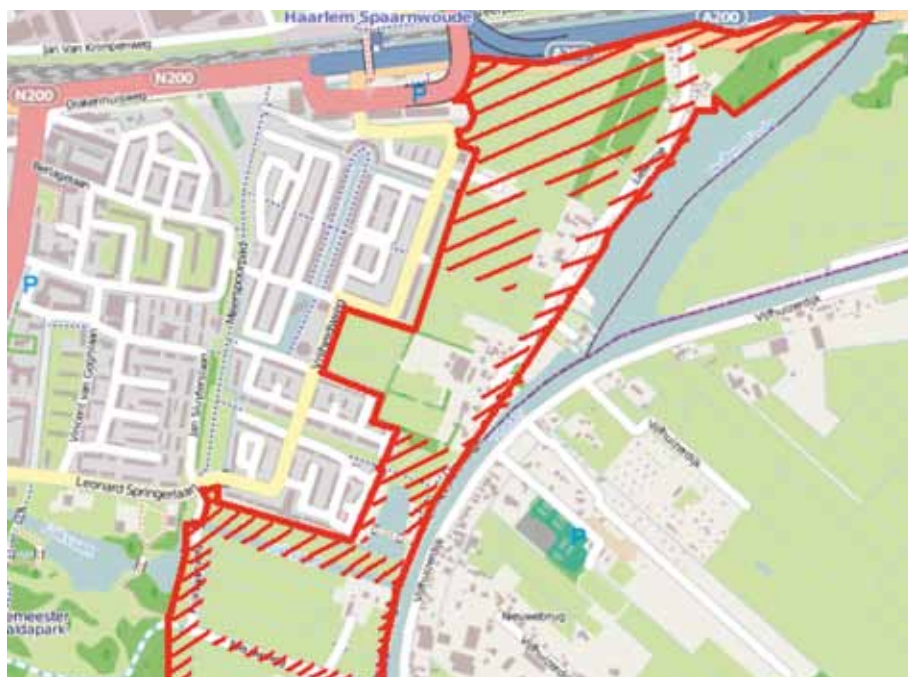
Kaart van het gebied. Het project gebied is rood omlijnd en de gemeentelijke grond, waar het groenbeheerplan voor geschreven wordt, is rood gearceerd.