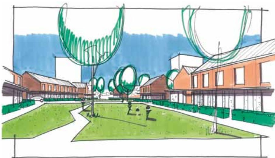
Impressie groene ruimte Jan Sluyterslaan

U ziet het, er gebeurt heel veel. Wilt u meer informatie over deze activiteiten? Neemt u dan contact op met Pré Wonen, consultant wijkbeheer Gratia Probst. Zij is te bereiken op telefoonnummer 088 77 00 000.