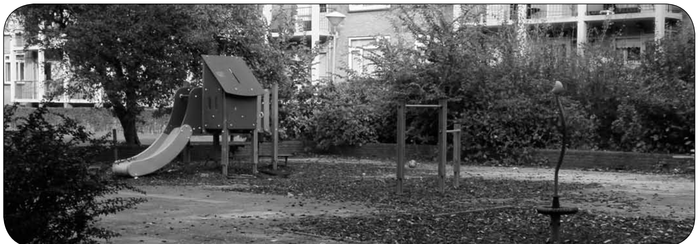
■ Speelplek in Parkwijk