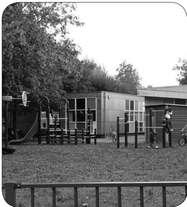
■ Gebouw Zuidparker