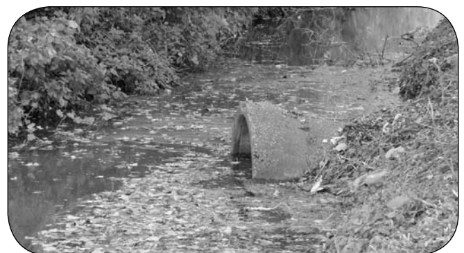
■ Duiker onder het fietspad door.