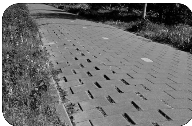
■ Een fietspad van asfalt moet dit voorkomen.

Besloten wordt de oever langs de trambaan recht te maken met een flauw talud van 1:3 zonder beschoeiing. De andere oever mag speels worden met variërend