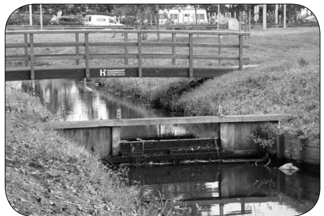
■ Stuw aan de noordzijde.

Aad van Ake, Zomerzone, geeft aan dat er een groene barrière is tussen de Zuiderpolder en Parkwijk. Er zijn weinig aansluitingen tussen beide wijken. Wellicht kan de strook tot een betere verbinding worden gemaakt.